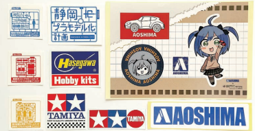
ステッカーイメージ