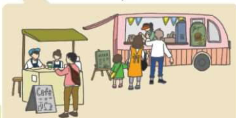
屋外でゆっくり食事を