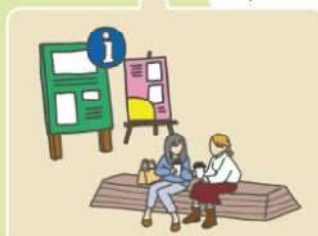
ひと休みのついでに 新たな発見を