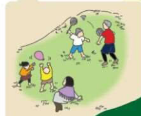
まちなかで 遊ぼう